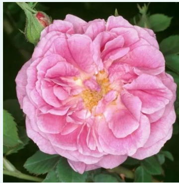
Queen of Bourbons

mittelrosa - historisch, damaszener rose 100-170 cm sehr stark duftende, den garten erfüllende rose - füllig, damaszener Alain Meilland