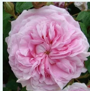
New Maiden Blush