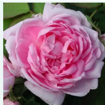
Marie de Blois

hell-rosa - historisch, alba-rose 120-190 cm außerordentlich stark duftende, schon von weitem wahrnehmbare rose - klassisch, rosig -