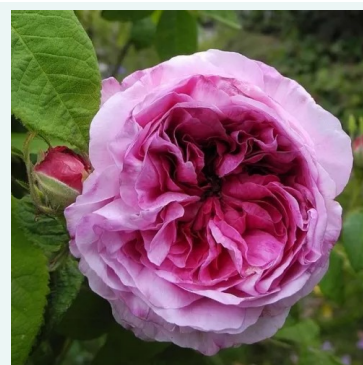
Président de Sèze