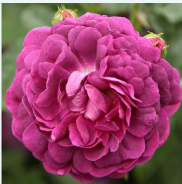
Cardinal de Richelieu

purpur-rot - historische, moosrose 120-190 cm außerst intensiver, den garten erfüllender duftrose - tief würziges aroma Jean Laffay