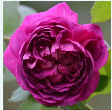
Reine des Violettes

rosa - historische, bourbon-rose 150-260 cm stark, voll duftende rose - voll, klassischer rosencharakter Mauget