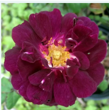
Nuits de Young

rosa - historisch, alba-rose 140-200 cm sehr stark, lang anhaltend duftende rose - duftbeschreibung nicht verfügbar James Booth