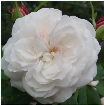
Boule de Neige