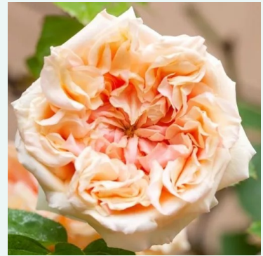
Gloire de Dijon

karmesinrot - historisch, bourbon-rose 130-180 cm stark, lang anhaltend duftende rose - voller, bourbon- ähnlicher Duft Rudolf Geschwind