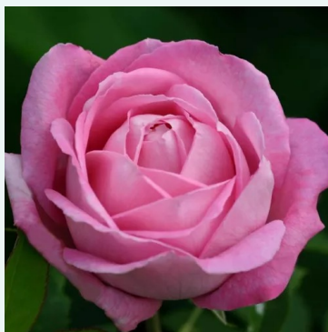
Mrs. John Laing